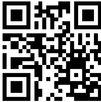
Дефиниране и характеристики на бизнес средата