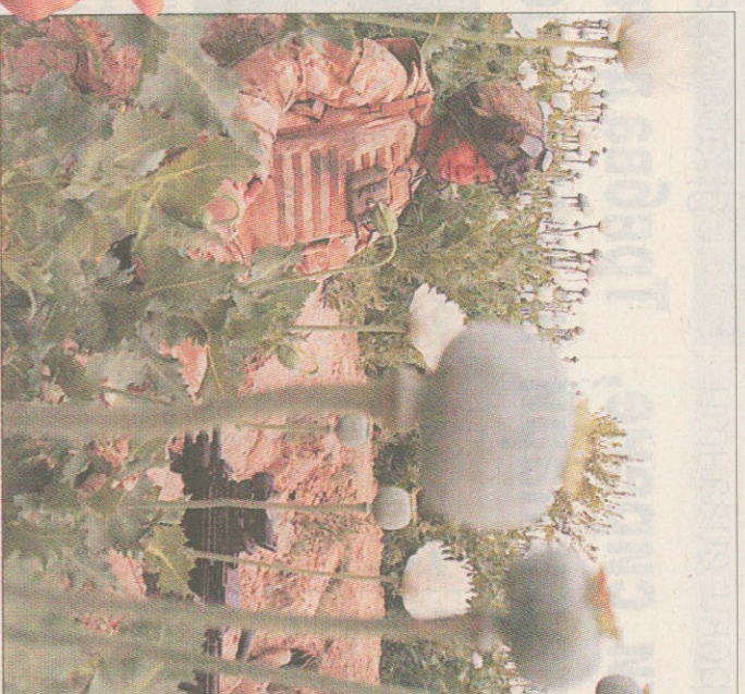
Афганистанският президент Хамид Карзай възхвали новата стратегия на САЩ за спечелване на войната срещу талибаните. Исламистите финансират бунта си основно с опуща от макините поделя в южните провинции Хелманд и Кандахар.

Междувременно в пакистанския град Пешавар талибани взривиха 12 камиона на НАТО с доставки за мисията в Афганистан. h