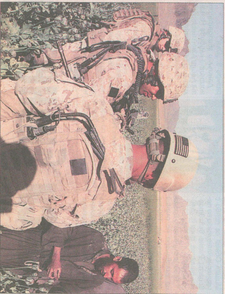
Афганистанци в окръг Говестан, провинция Фарах, събират порежната реколтата от опиймен мак през погледа на американски командоси. Черните „свъзи“ (снимката врясно) на опийния мак превръщат страната в монополист в суровина за хероин в света. Американски хеликоптер кобра (снимката долу) патрулира над Фарах. Но няма право да атакува мажорите мантаци - говорими за земеделе бие пак.